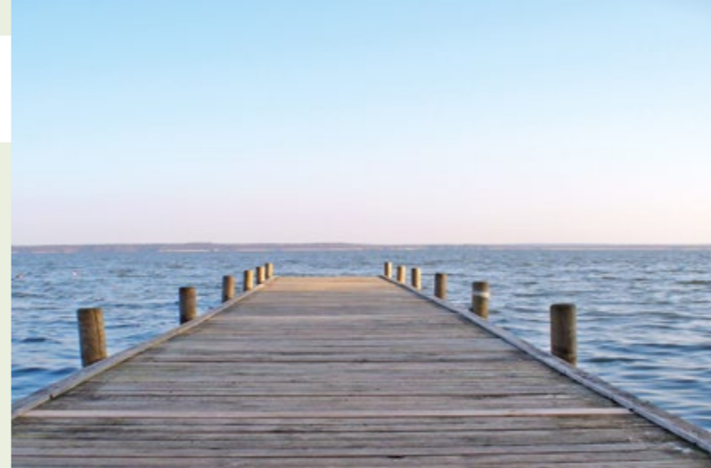
Ausblick auf das Steinhuder Meer